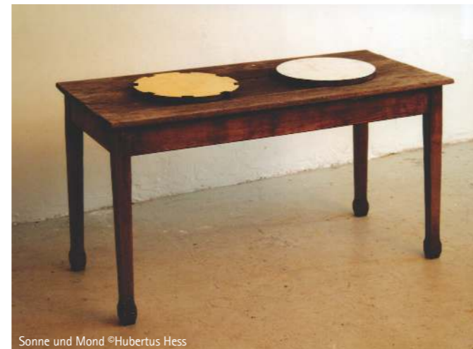
Sonne und Mond