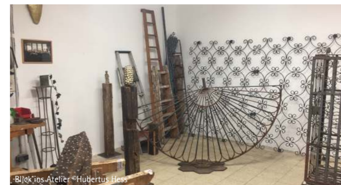
BJek's Atelier ©Hubertus Hess

Lives and works in Nuremberg Many of his works can be found in public spaces, as well as public and private collections.