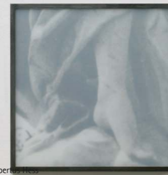
Fragmente III ©Hubertus Hess